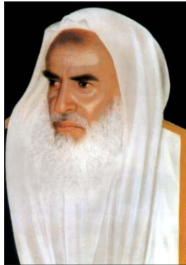
Muhammed b. Sâlih el-Useymin

Useymîn, Hanbelî-Selefi ekolüne mensup olmakla birlikte fıkıhta Hanbelî mezhebine ve İbn Teymiyye’ye birçok konuda muhalefet etmiştir. Gösterişe önem vermemesi, güzel ahlâkı, hayır işlerine katkısı, geniş kitlelere ders ve fetvalarıyla ulaşması, gerek derslerinde gerek ihtiyaçlarını