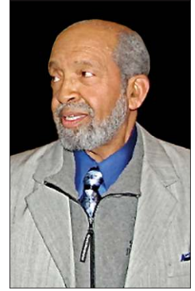
Warith Deen Muhammed

Warith Deen Muhammed, zenciler için güçlü bir kimlik inşa etme ve onların kölelik psikolojisinden kurtulmalarını sağlama gibi önemli bir misyonu da üstlenmişti. İlk olarak İslâm Milleti üyesi zencilere kölelik zamanında efendilerinin verdiği soyadları değiştirmelerini, bunun yerine geleneksel müslüman isimleri almalarını telkin etti. Ona göre zencilerin köleleştirilmesi onların kimliklerine zarar verdi, özgüven ve kişilik kaybına yol açtı. Harekete mensup kadın ve erkek üyelerin doğru bir eğitimle özgürleşmesi, böylece gerçek müslüman kimliği kazanması gereğini savundu. Bu süreçte İslâm'ın ilk müezzini olan zenci