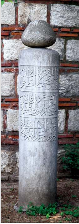
Demircikulu Yûsuf Efendi'nin Karabaş Tekkesi hazîresindeki mezar taşı

din ve alâ âli Muhammedin ve sellim teslîmen" cümleleri yazılıdır. Yûsuf Efendi'nin Sakıp Sabancı Müzesi koleksiyonunda (nr. 100-0365) 977 (1569) tarihli, ketebeli, güzel nesih hatla yazdığı bir mushaf-ı şerifi bulunmaktadır. 21,3 x 12,5 cm. ebadındaki bu mushaf 370 varak, sayfada on üç satır halinde tasarlanmış, serlevha, sûre başları, duraklar ve güller tezhip edilmiştir. Cildi XX. yüzyıla aittir. Ferağ kaydında, "Ketebe Yûsuf b. Abdullah Memlûk-i Ali Ağa afe'llâhü anhümâ" yazılıdır.