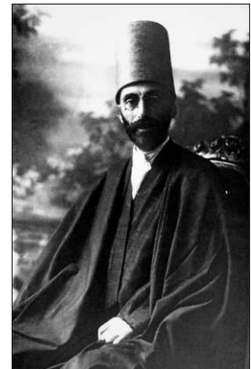
Yusuf Zâhir Efendi

Yusuf Zâhir Efendi aynı zamanda 1902 yılından itibaren çeşitli medrese ve mekteplerde müderrislik ve muallimlik yaptı, bir ara ilmiye maaşı aldı. 1925'te tekke ve zâviyelerin kapatılmasından sonra 7 Ekim 1926'da Üsküdar Hacı Selim Ağa Kütüphanesi hâfızkütüplüğüne tayin edildi. Soyadı Kanunu çıkınca Hasircioğlu soyadını aldı. 1948'de yaş haddinden emekliye ayrılınca kadar Süleymaniye, Ayasofya ve Râgıb Paşa kütüphanelerinde müdürlük yaptı. Emekliliğinin ardından 6 Ekim 1955 tarihine kadar Başbakanlık Arşiv Umum Müdürlüğü'nde eski metinler uzmanı olarak çalıştı. 9 Mayıs 1956 tarihinde vefat eden Yusuf Zâhir Efendi'nin cenazesi, damadı tarihçi ve yazar Midhat Sertoğlu'nun girişimleri sonucu çıkarılan Bakanlar Kurulu kararıyla doğduğu ve hayatını geçirdiği Hasîrîzâde Dergâhı ile Mahmud Ağa Camii arasındaki hazîreye defnedildi.